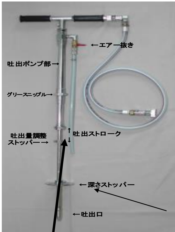
施肥量設定目安表