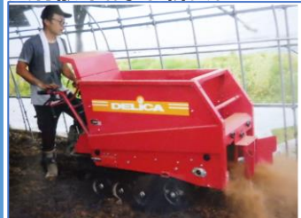
資材散布および耕うん