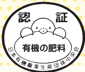
有機肥料工場の認証マーク